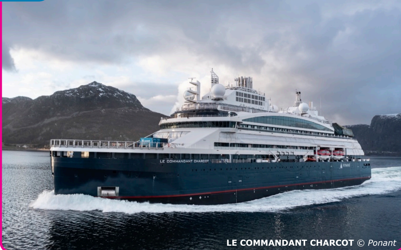
LE COMMANDANT CHARCOT