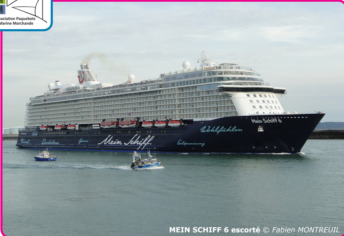
MEIN SCHIFF 6 escorté