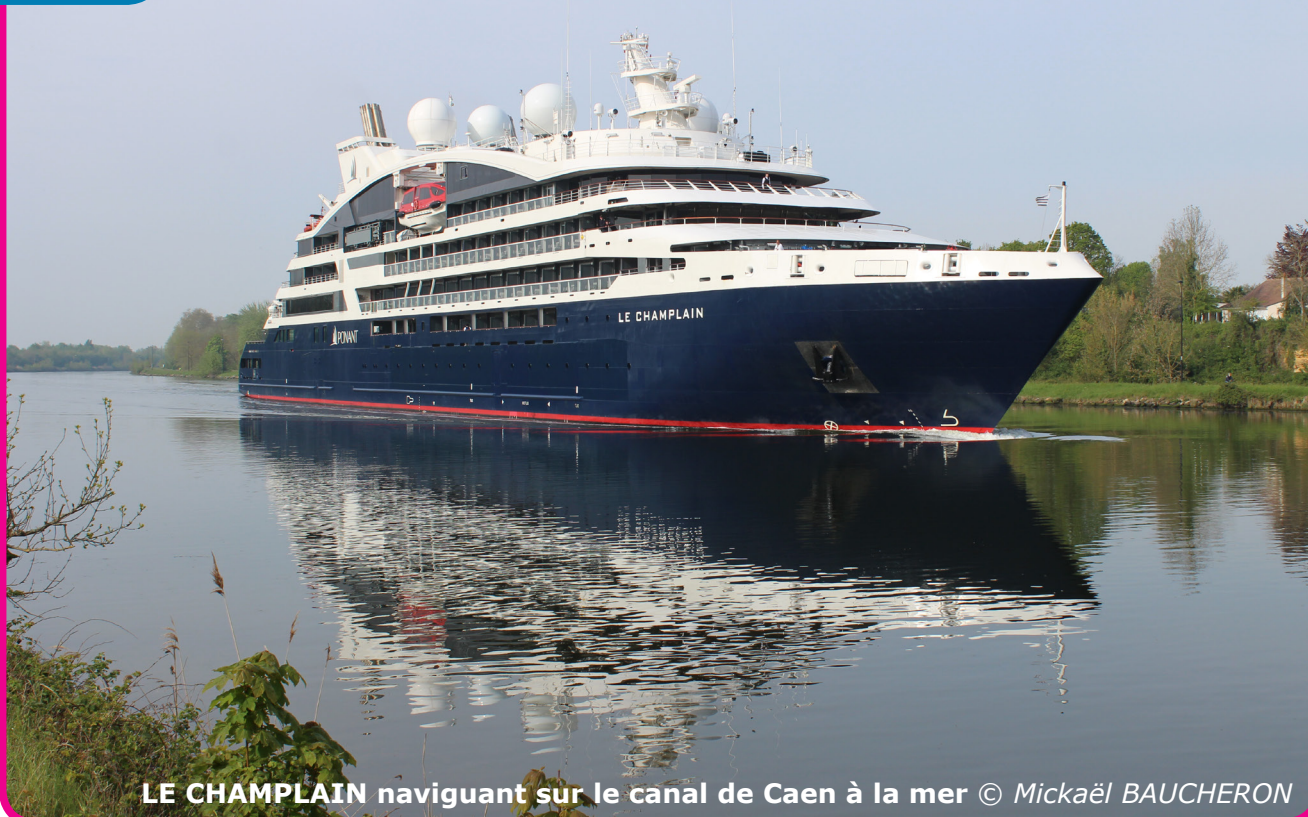
LE CHAMPLAIN navigant sur le canal de Caen à la mer