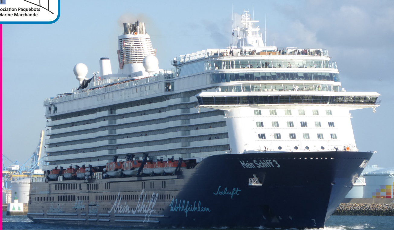
MEIN SCHIFF 3 quittant Le Havre