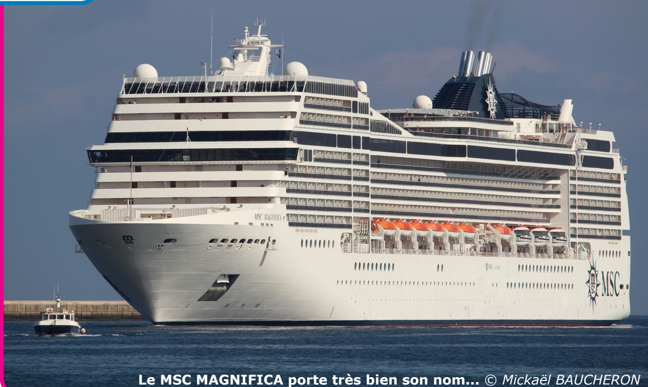
Le MSC MAGNIFICA porte très bien son nom...