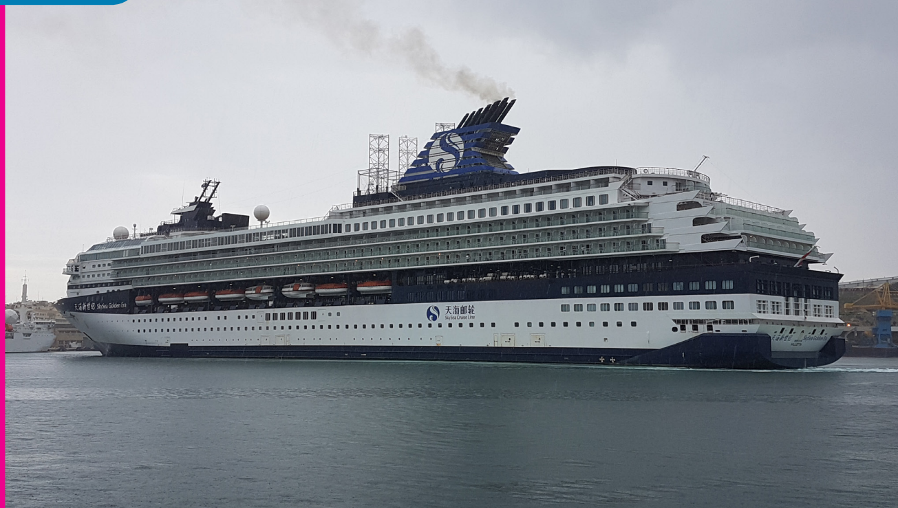
Manoeuvre du SKYSEA GOLDEN ERA à La Valette (Malte)