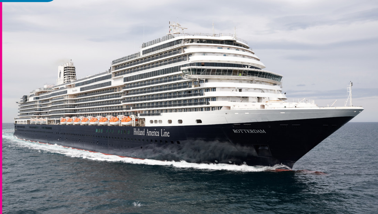
Le nouveau navire amiral de Holland America, le ROTTERDAM